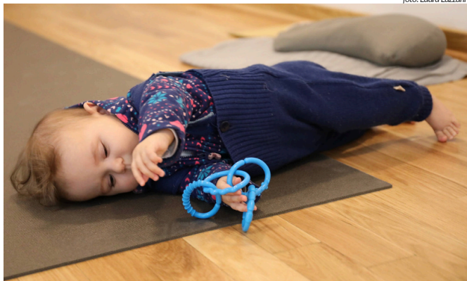
Auf der Seite zu liegen und zu spielen ist eine hohe Leistung des Gleichgewichts und der muskulären Feinabstimmung. Die Zehen stabilisieren die Lage.

Zugleich lernen Babys das Lernen: sie sind es, die ihre Fortschritte initiieren und die durch ihr unermüdliches Üben weiterkommen. Das Kind ist Akteur seiner Entwicklung und erlebt ermutigende Erfolge. Selbstwirksamkeit ist ein wichtiges Element der psychischen Entwicklung. Vertrauen in die eigene Wirksamkeit wird durch selbständiges, freies Bewegungslernen gefördert.