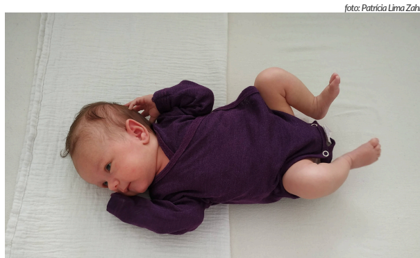
Ein junges Baby muss zunächst seine sichere Lage auf dem Rücken finden. Eine feste, flache Unterlage ist dafür wichtig.

Bewegen des Kopfes, beispielweise wenn sie ihren Eltern mit dem Blick folgen, entsteht eine erste Form der Kopfkontrolle unter Abnahme des Gewichts und mit unverkrampfter, freier Nackenmuskulatur. Aus den anfänglich