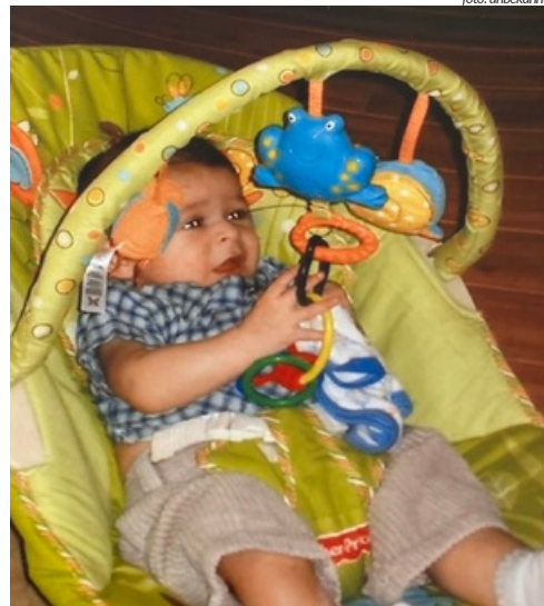
In einer Wippe sitzend hat das Kind keine Möglichkeit, seine Bewegung aktiv zu entwickeln. So können auch eventuelle Asymmetrien nicht ausgeglichen werden.

oder Autoschale sitzt, neigt sich der Kopf unwillkürlich auf die „Lieblingsseite“. Dadurch verfestigt sich die einseitig verkürzte Nackenmuskulatur weiter. Liegend fällt es dem Kind dann umso schwerer, seinen Kopf zur vernachlässigten