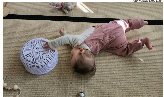
Aus eigenem Antrieb erarbeitet sich das Kind die Drehung auf den Bauch und übt dabei Rumpfmuskulatur, Gleichgewicht und Beweglichkeit.

Eine bedenkliche Folge der frühen Bauchlage, die wir häufig in unserer Physiotherapiepraxis beobachten, ist der Mangel an Drehbewegungen des Rumpfes . Manche Babys entwickeln dadurch, dass sie passiv umgelagert werden, nicht die Voraussetzungen, sich selbständig zu drehen. Diese Kinder verbleiben in den Körperpositionen mit großer Unterstützungsfläche, der Rücken- und Bauchlage, da sie keinen Anlass und auch keine Erfahrung damit haben, sich selbstständig zu drehen. Sie lernen dann zwar, sich vom Bauch aus nach und nach in die Aufrichtung zu arbeiten, jedoch mit mehr Anspannung und weniger Feinabstimmung der Bewegungsübergänge und des Gleichgewichts. Die Rotationsmuskulatur, die sowohl für die Beweglichkeit, als auch für die Stabilität des Rumpfes entscheidend ist, wird dabei wenig aktiviert. Herausforderungen für den Gleichgewichtssinn , mit denen sich der Säugling auseinandersetzt, wenn er Übergänge vom Rücken in die Seitenlage, von der Seitenlage in die Bauchlage und zurück übt, bleiben weitgehend aus. Ebenso fehlt das fein dosierte Heben und Ablegen des Kopfes, was bei Babys, die sich selbständig drehen, so erstaunlich gelingt: eine Meisterleistung der Kopfkontrolle.