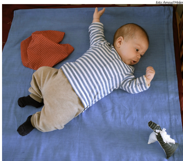
Etwa am Ende des ersten Quartals entdeckt das Baby seine Hände und erkundet sie vielfältig.

In der frühen Bauchlage ist dieser Prozess nicht möglich. Die Hände liegen gefaustet unter oder neben dem Rumpf und stehen zum Erkunden nicht zur Verfügung. Manchmal kann man Babys, die in den ersten Monaten viel Zeit auf dem Bauch verbracht haben, später noch an den eingezogenen Fingern erkennen.